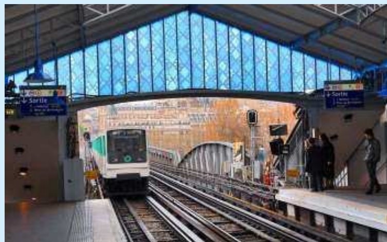
M o BIR-HAKEIM, LIGNE 6 : LES TYMPANS « NUIT ET JOUR ». Offerts par le métro de Chicago, ces tympanes en verre sont installés à chaque extrémité de la toiture de cette station aérienne. Le bleu (notre photo) est visible direction Etoile ; le jaune, direction Nation.