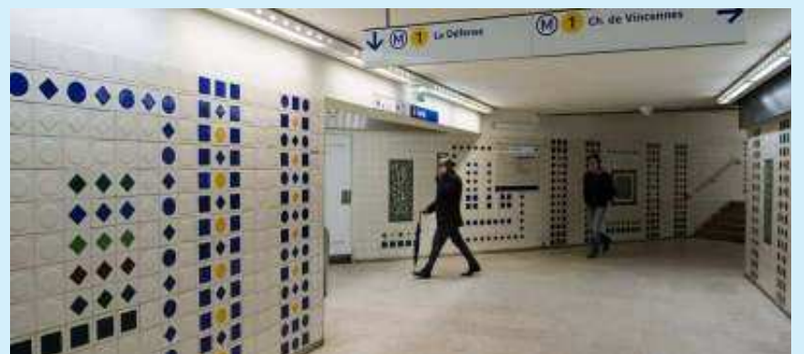
M o CHAMPS-ÉLYSÉES-CLEMENCEAU, LIGNES 1 ET 13 : « LA MOSAÏQUE ». Cette fresque colorée en azulejos a été offerte à la RATP par le métro de Lisbonne. Elle est l'œuvre de l'artiste Manuel Cargaleiro.