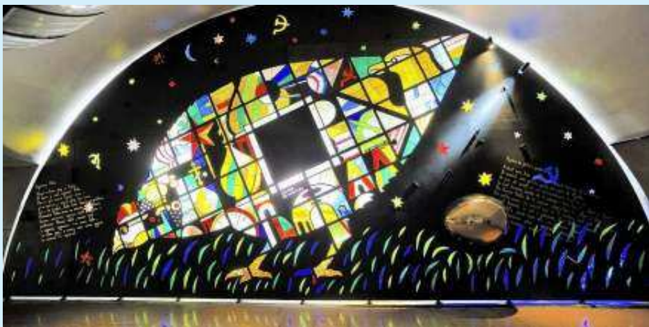
M o MADELEINE, LIGNE 14 : « RYABA LA POULE ». Cette œuvre a été offerte par le métro de Moscou en échange d'une entrée Guimard. Cette œuvre d'Ivan Loubennikov est un hommage à la culture populaire russe. Vingt panneaux incrustés de verre coloré sont installés sur une surface de 40 m 2 . Un œuf en or pesant 80 kg trône même au centre de l'œuvre.

au public. Les visiteurs auront même la possibilité d'entrer dans les couloirs d'un tournage à travers les décors d'un film d'époque. D'autres stations fantômes seront visibles par les voyageurs lors des Journées du patrimoine. La station Croix-Rouge (ligne 10 avant Cluny), visible dans le parcours Art et la station Arsenal (ligne 5 avant Bastille) visible dans le parcours Famille d'aventuriers.