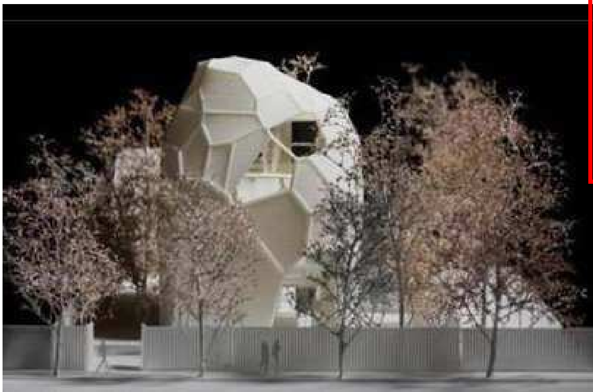
Voici la villa imaginée par un cabinet d'architectes pour le patron d'un grand groupe industriel sur l'avenue Robert-Schuman à Boulogne. La bâtisse comprendra trois étages, une piscine en sous-sol et une annexe au fond du jardin. Une enveloppe blanche recouvrira sa structure constituée de métal, de béton et de verre.