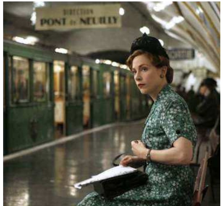
Située sous la station Porte-des-Lilas, cette gare ne sert que pour les tournages, comme celui des « Femmes de l'ombre », avec Julie Depardieu.

5 Parcours Fantastique (1 h 30). Peut-être le plus ardu et le plus énigmatique. Les voyageurs seront amenés à fréquenter la ligne 6.