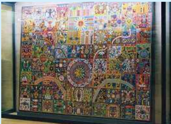
M o PALAIS-ROYAL - MUSÉE-DU-LOUVRE, LIGNES 1 ET 7 : « LA PENSÉE ET L'ÂME HUICHOLES ». Offerte par le métro de Mexico, cette fresque (ci-dessus) s'admire à l'entrée du carrousel du Louvre. Elle est constituée de deux millions de perles de 2 mm de diamètre. Cette œuvre n'est pas la seule que l'on peut observer dans cette station. L'entrée située place Colette est, elle, ornée du KIOSQUE DES NOCTAMBULES (ci-contre), réalisé par le plasticien Jean-Michel Othoniel à l'occasion du 100 e anniversaire du métro parisien.

frises carrelées. Sur toute la ligne 12, les noms des directions (Montmartre et Montpamasse) sont inscrits en céramique, à l'entrée de chaque tunnel. Même les grands panneaux publicitaires ont un encadrement différent des autres stations... Mais le métro parisien est aussi décoré d'œuvres d'art — parfois offertes par d'autres compagnies de métro — bien souvent ignorées des voyageurs. En voici cinq illustrations.